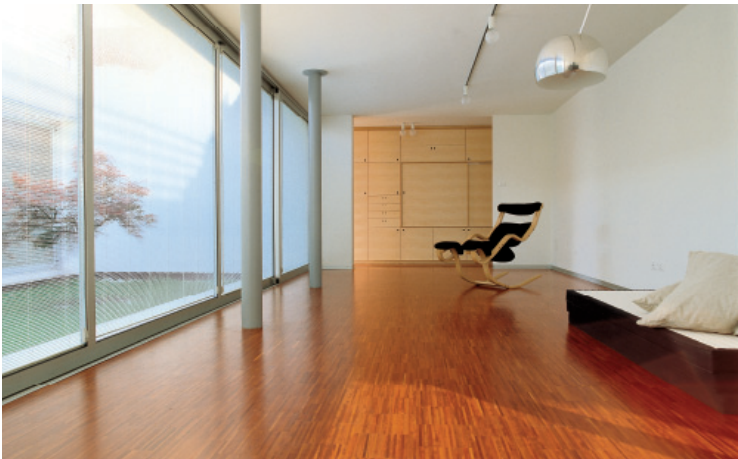
Privates Haus / Maison privée ScreenLine-Jalousie-Systeme in großen Schiebe-Hebe-Türen Stores ScreenLine sur grandes fenêtres coulissantes