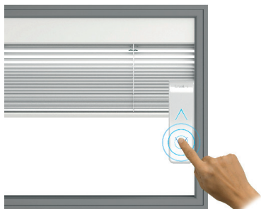
Senken / Descente