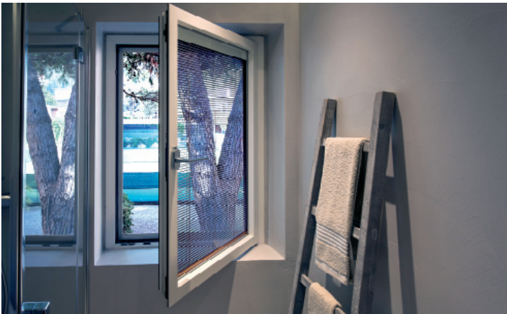
Privates Haus / Maison privée ScreenLine motorische Jalousie im Dreh-/Kipp-Fenster Store motorisé ScreenLine sur fenêtre battante