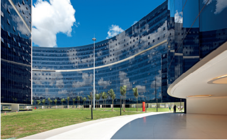
Cidade Administrativa Minas Gerais - Brasilien 22.000 integrierte Sonnenschutzsysteme von ScreenLine 22.000 stores intégrés ScreenLine

ScreenLine propose des produits de haute technologie, réalisés grâce à l'expérience de Pellini dans le domaine de la protection solaire depuis 1974, et crée des solutions pour l'économie d'énergie en collaboration avec les cabinets d'architectes les plus renommés au niveau international.