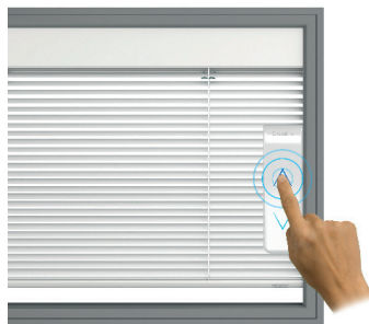
Heben / Relevage